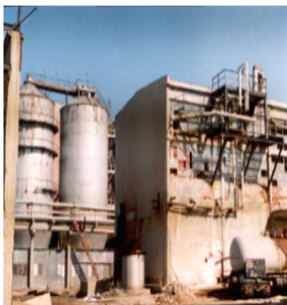
№12, Код 6-SOFXX-219 по областен план за РР